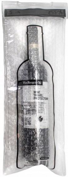
PLURIBOOL TRAVEL C/MANIGLIA

SERIE EXPRESS PER LA SPEDIZIONE DELLE BOTTIGLIE • CARTONE ACCOPPIATO MICRO TRIPLO • INSERTO SEPARATORE PROTETTIVO, RESISTENTE E SICURO • VIDEO DIMOSTRATIVO MIRANDO IL QR CODE CON L'APPOSITA APP (esempio i-nigma) EXPRESS BOXES SUITABLE FOR BOTTLES SHIPMENT • TRIPLE MICRO-CORRUGATED CARDBOARD • PROTECTIVE SEPARATOR, EXTREMELY STRONG • DEMONSTRATIVE VIDEO AIMING AT QR CODE WITH THE SPECIFIC APP (i-nigma)