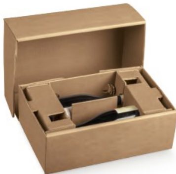
EXPRESS 2 BOTT. 390x270x130 Art. 35429