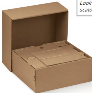
EXPRESS 3 BOTT. 370x350x155 Art. 35430