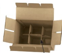
DIVISORI AUTOMONTANTI SELF-ASSEMBLING SEPARATORS