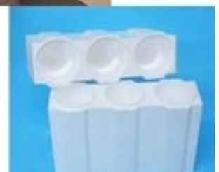
Cantina Polistirolo 3-6 bottiglie